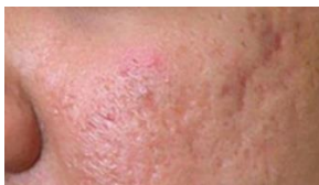
Litteken op de wang