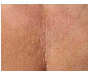
Lijntjes op décolleté