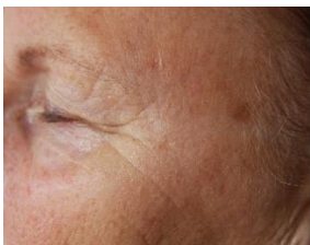
Kraaienpootjes en hyperpigmentatie